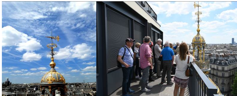
girouette surmontée du caducée d' Hermès Dieu du Commerce

La création des passages couverts a marqué une époque avec la mise en valeur des articles de luxe et des nouveautés de la mode. Le commerce prendra un nouvel essor avec l'apparition des Grands Magasins.